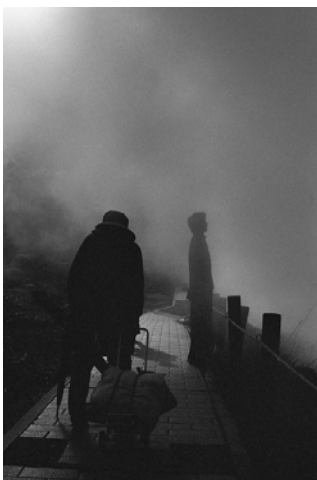
Ten Disciples(2016) TY_TD#040 p: 11x14 inch Edition of 10 Silver Gelatin Print ©Tsutomu Yamagata