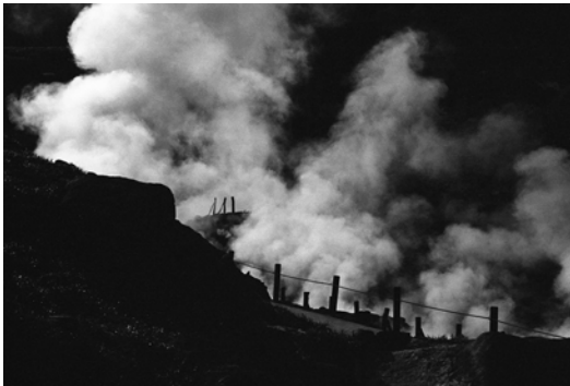
Ten Disciples(2016) TY_TD#002 p: 11x14 inch Edition of 10 Silver Gelatin Print ©Tsutomu Yamagata