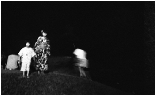
Ten Disciples(2016) TY_TD#063 p: 11x14 inch Edition of 10 Silver Gelatin Print