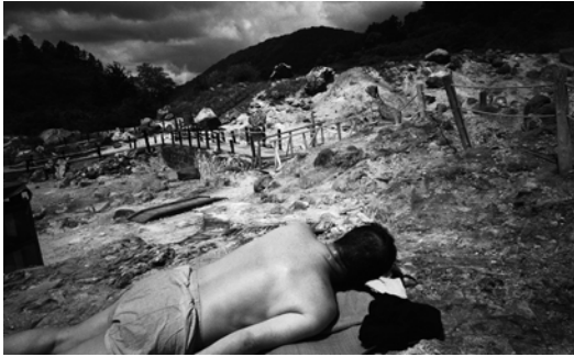
Ten Disciples(2016) TY_TD#009 p: 11x14 inch Edition of 10 Silver Gelatin Print ©Tsutomu Yamagata